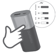
INDICADOR DE CARGA DE LA PILA