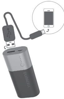
CARGA TU DISPOSITIVO