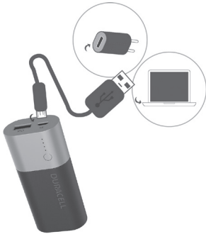
CARGA LA PILA PORTATIL